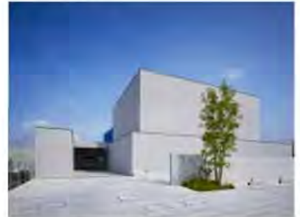
↳ Bleu Blanc, Aichi