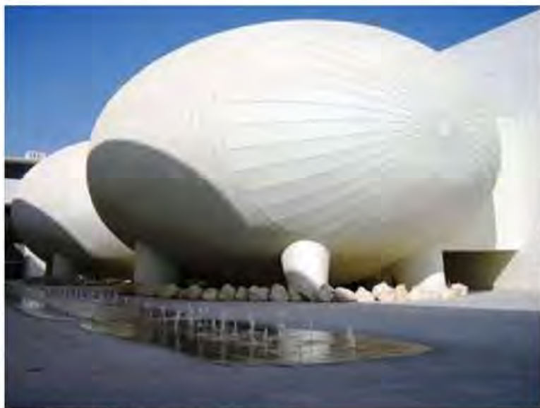
Arata Isozaki, il Weill Cornell Medical College in Qatar

Come ben sappiamo la Biennale di Venezia non è solo nei luoghi noti al più, ma porta con sé tutto quello strascico di eventi collaterali dislocati nella città, spesso di alto livello. Una biennale nella biennale, in questa edizione dedicata all'architettura, è il progetto "Traces of centuries & Future steps", che vede coinvolti 57 architetti chiamati a rappresentanza di 26 paesi.